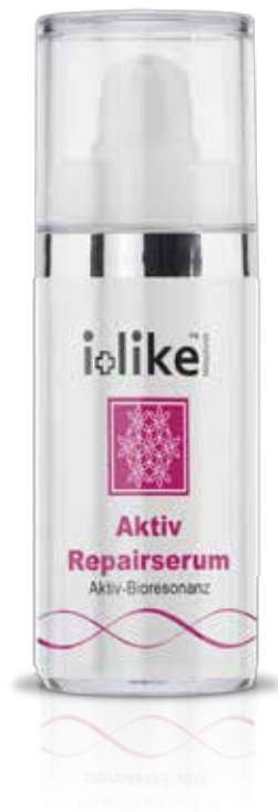
Sérum réparateur actif

Renforce le renouvellement cellulaire et favorise l'effet d'auto-réparation.