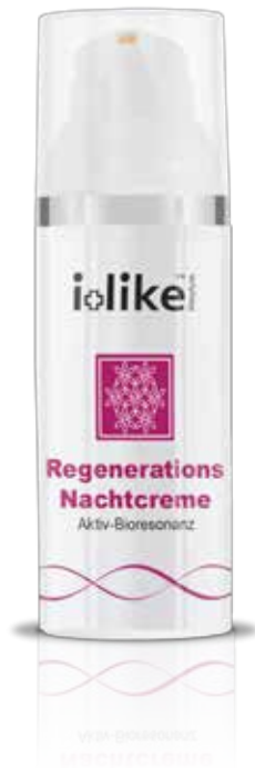
Crème de nuit régénérante

Renforce la régénération de la peau pendant la nuit, procure une hydratation précieuse.