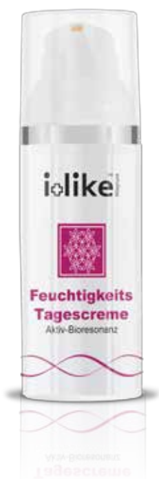
Crème de jour hydratante

Protection active contre les influences environnementales.