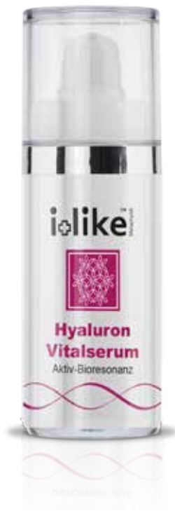
Sérum vital d'acide hyaluronique

Supprime les rides, revitalise, régénère la peau et équilibre les zones réflexes.