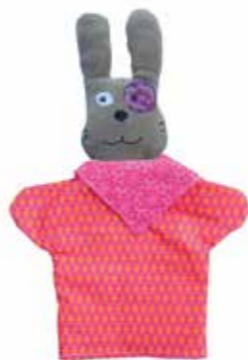
Marionnette Louison Tout doux comme un doudou, il peut se transformer en marionnette pour raconter une histoire aux petits ou laisser se déployer l'imagination des plus grands. LO05 27,90€