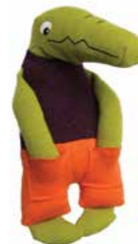
Croco In The Pocket Hauteur 23cm POK01 29,90€

Entretien : article lavable à 40°. CER3 29,90€