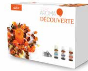
Coffret AROMA DECOUVERTE COF9014 19,90€

Eveillez tous vos sens tout en vous relaxant!