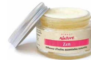
Diffuseur Eponge CŒUR DE PROVENCE DIFE185 10,90€

Le Géranium et le Ylang ylang vont vous aider à vous évader. L'Orange et le Pamplemousse vont favoriser la relaxation, la méditation et la détente. Ajoutez la douceur de la Verveine exotique et laissez vous emporter par la «ZEN attitude»... Composition : Géranium, Orange, Verveine (litsea), Petit grain, Ylang, pamplemousse.