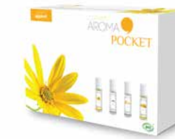
Coffret AROMA POCKET COF9015 29,90€

Idéal pour découvrir les puissantes vertus des huiles essentielles