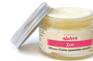
Diffuseur Eponge FORET EUCALYPTUS DIFE183 10,90€

Le Ylang ylang et le Cananga sont des huiles très subtiles et enivrantes. Retrouvez les parfums chauds et fleuris des tropiques. Composition : Orange douce, Canaga odorata, Ylang Ylang