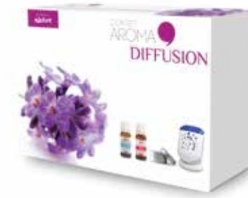
Coffret AROMA DIFFUSION COF9008 39,90€

Contenu du coffret : 1 diffuseur galet poreux autonome 1 mélange d'huiles essentielles Zen 10ml 1 mélange d'huiles essentielles Forêt d'Eucalyptus 10ml 1 Diffuseur par ventilation Aroma Wind 20 m2 (piles incluses) 1 guide d'utilisation des huiles essentielles 80 pages