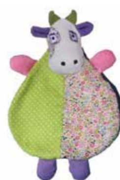
Doudou Lili Hauteur 28cm VA05 29,90€