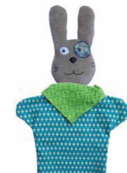
Marionnette Jeannot Tout doux comme un doudou, il peut se transformer en marionnette pour raconter une histoire aux petits ou laisser se déployer l'imagination des plus grands. JE05 27,90€