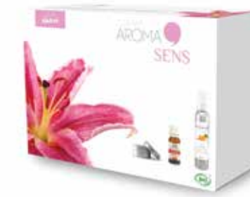
Coffret AROMA SENS COF9013 24,90€

Détente et relaxation sont au programme!