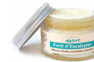
Diffuseur Eponge TROPIQUES DIFE182 10,90€

Au quotidien ce mélange convivial est fatal aux mauvaises odeurs. Composition : Verveine exotique (litsea cubeba), Orange, Bois de rose, Petit grain, Menthe poivrée, Citron, Pamplemousse.