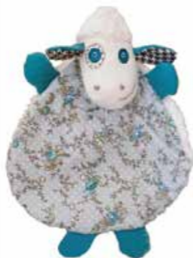
Doudou Antonio Hauteur 28cm MO04 29,90€