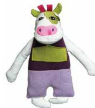
Vache In The Pocket Hauteur 23cm POK13 29,90€