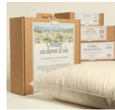
Oreillers avec AMORTI SOUPLE