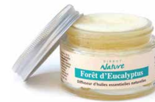
Diffuseur Eponge ZEN DIFE184 10,90€

Redécouvrez les recettes de nos grands-mères pour lutter contre les coups de froid et le nez qui coule. Composition : Cajeput, Pin de Sibérie, Eucalyptus, Niaouli, Ravintsara