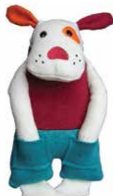
Chien In The Pocket Hauteur 23cm POK14 29,90€