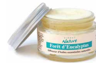
Diffuseur Eponge RELAXANT DIFE180 10,90€

Sans prise de courant, ce diffuseur éponge sera présent dans votre salle de bain, toilettes, petit bureau et/ou sur votre table de nuit pour agrémenter ces lieux d'une senteur qui vous fera voyager. L'éponge contenue à l'intérieur du pot sert de diffuseur en faisant remonter en surface les huiles par capillarité. Principe de diffusion naturelle avec nos huiles essentielles 100% pures et naturelles. Pour pièce d'environ 7 à 8 m².