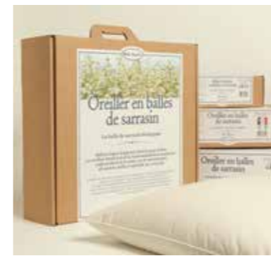
Oreiller Fermé et Statique