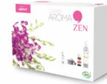
Coffret AROMA ZEN COF9012 24,90€

Idéal pour assainir l'air de votre maison!